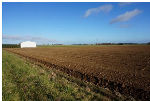
Till höger om ladan stupade Wittmann

Punkt 18 Wittmanns död Den 6 augusti började den engelska offensiven mot Falaise, Operation Totalize och ett tyskt motanfall inleddes den 8 augusti vid Gaumesnil med delar ur 1.-och 12.SS pansardivisionerna däribland Michael Wittmann med fyra Tigrar. De utsattes för överraskande beskjutning från två håll och samtliga vagnar slogs ut. Samtliga i Wittmanns besättning stupade och diskussionen fortgår vem som var hans baneman.