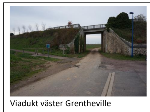
Viadukt väster Grentheville

Då järnvägsbanken var svår att ta sig över för stridsfordonen var viadukterna viktiga inte minst för de lättare fordonen