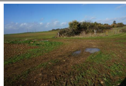
Walthers position söder Le Poirier