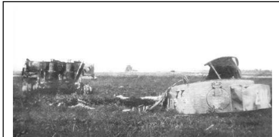
Wittmanns förstörda Tiger