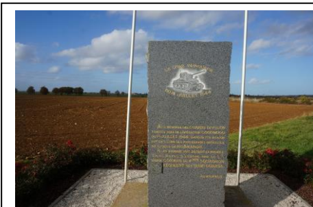
Minnesmärke över Gorman